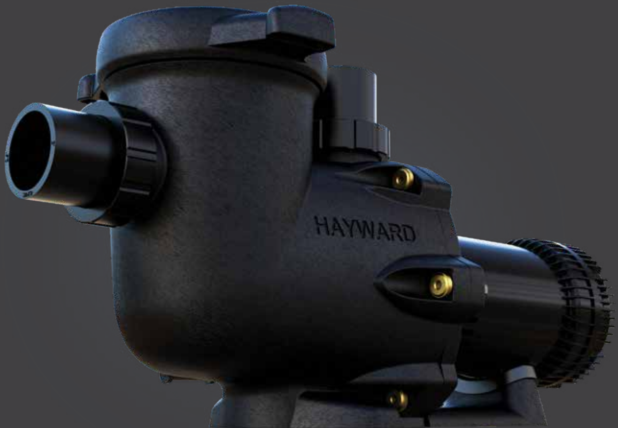
TRISTAR® XE ULTRA-HIGH EFFICIENCY PUMP POMPE ULTRA HAUTE EFFICACITÉ TRISTAR XE

ULTRA HAUTE EFFICACITÉ, COÛT TOTAL DE PROPRIÉTÉ ULTRA BAS